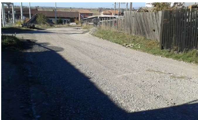
A József Attila utca

Rövid ráhangolódás után elkezdtek a vállalt munkát. A legfontosabb feladat a József Attila és az Eminescu utcákban elkezdett útjavítási munkálatok folytatása volt. Majd két hónapos vita után sikerült egyezsége jutni a kivitelező céggel, és hozzáfogtak a munkálatokhoz.