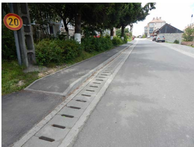
A Mihai Eminescu utca(belső)

Egy másik súlyos probléma, ami érintette városunkat, hogy a fűrészpont beszállító cég egyoldalúan felmondta a szerződést, és ezzel nagy gondot okozott a kazánház további működésében. Tovább nehezítette a hivatal munkáját a 2016. májusában érvénybe lépett közbeszerzési törvény, amely a fűrészpontos licitre 45 napos hirdetési időt szab meg. Sajnos, az első hirdetésre nem jelentkezett egyetlen beszállító sem. A második hirdetés után jelentkező cég már nagyobb áron szállította a tüzelőt. Az okozott kárt bírósági úton próbáltuk megtéríttetni a szerződést bontó céggel, ami az alapfokú döntés értelmében részben sikerült is. 2017-ben, a tűzifapiacra bekövetkezett hiány és a lakókra