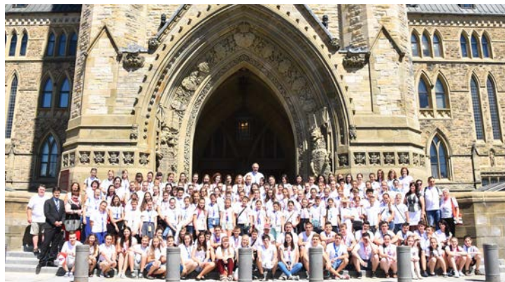
Kanada, az Ottawai Parlament előtt 2017. június 26.