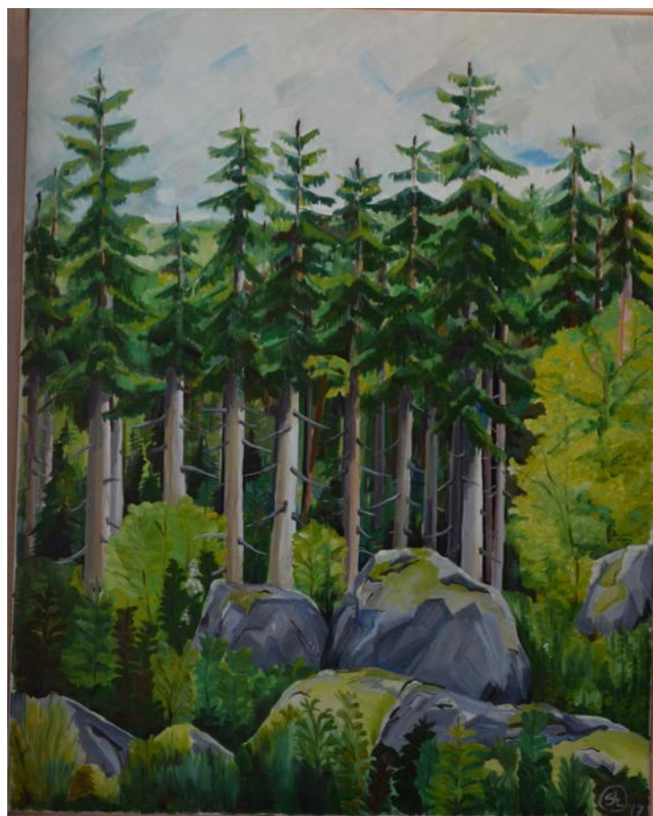
Szőcs Levente : A kő marad

XX. szentegyházai városnapok 2017. július 14, 15, 16. Részletes program az utolsó oldalon. Szeretettel várunk mindenkit.